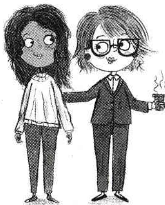
Mătușa Amara Mătușa Rosă